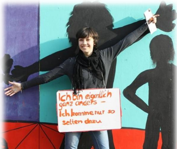
„Ich bin eigentlich ganz anders - ich komme nur so selten dazu“ – eine Jugendliche voller Energie & Spaß

Samstagnachmittag - mitten in Freiburg – 25 junge Christen laufen mit Schildern durch die Fußgängerzone. Sie verschenken Geld, verteilen Kaffee an Obdachlose und kommen mit den unterschiedlichsten Persönlichkeiten ins Gespräch. Jugendliche aus unterschiedlichen CVJM's Südbadens haben sich auf den Weg gemacht, um über ihren Glauben zu sprechen. - Jugendliche werden „Aktiv“. Die Reaktionen darauf waren ganz unterschiedlich. Ein Bettler erzählt von seinem Schicksal, eine Frau ist froh, dass es auch doch noch „anständige Jugendliche“ gibt, die sich für andere Menschen einsetzen. Eine andere Dame sieht das Schild: „Ich bin eine Sehenswürdigkeit“ und dreht sich weg, geht